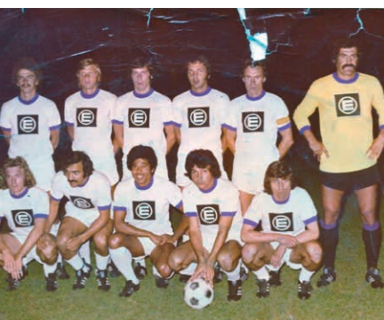
▽ 1974: Kapitän Robert Sara und viele weitere Austria-Stars wie Prohaska, Obermayer, Pirkner, Köglberger, Krieger oder die „Urus“ Martinez und Morales.

Also belassen wir es bei ein paar „Schmankerln“: